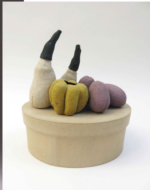
Boîte à chapeaux

GALERIE ANDRE GOMBERT 10, RUE DE LA GRANGE- BATELIERE 75009 PARIS ENTREE LIBRE DU JEUDI 8 DECEMBRE AU DIMANCHE 18 DECEMBRE DE 11H A 19H